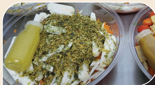
סלט גזר וקולורבי