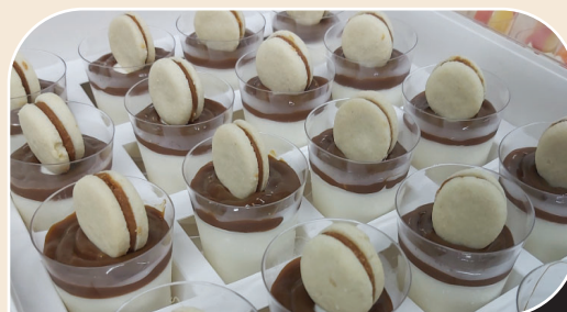
קינוחי כוסות מעורב