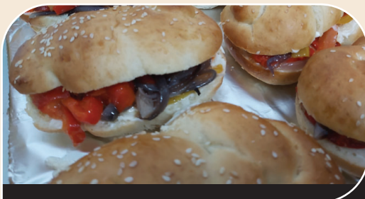
כריך אנטי פסטי