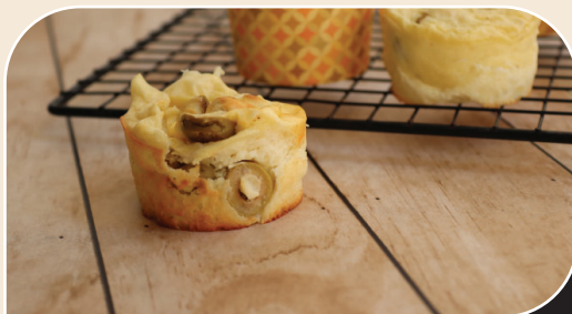
פשטידות גבינה אישיות