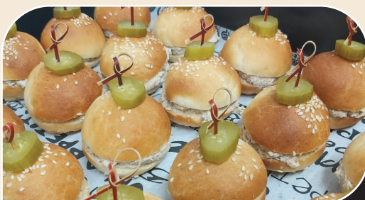
כריכוני ביס - טונה