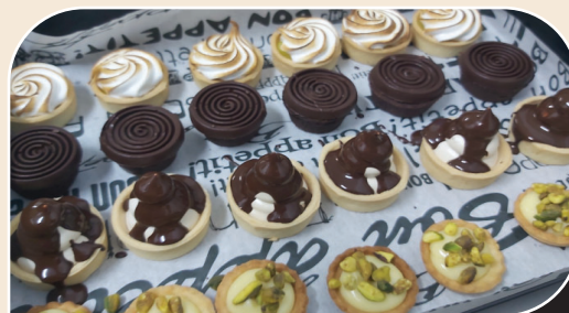
מיני טארטלט מתוק מעורב