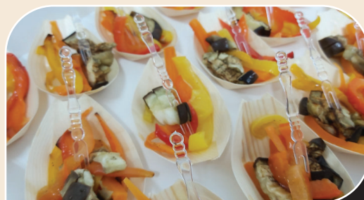
מגשיות אנטי פסטי

מגש מרובע 270 ₪ מתאים ל5 איש, כולל מציות