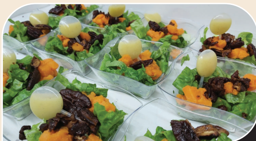
צלוחיות סלט פינוק