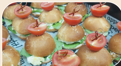
כריכוני ביס - ביצה