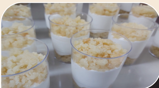
כוס גבינה פירורים