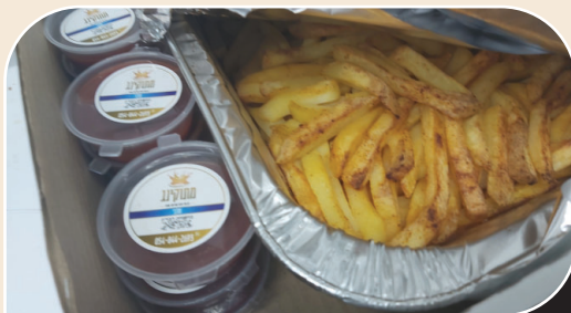
מגש צ'יפס וקטשופ