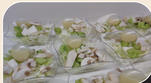
צלוחיות סלט הבית