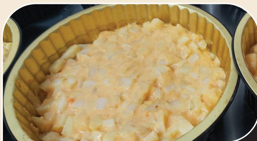
פסטה ברוטב בטטה

2 תבניות A4 180 ₪ הקרמה גבינה צהובה - תוספת 20 ש"ח