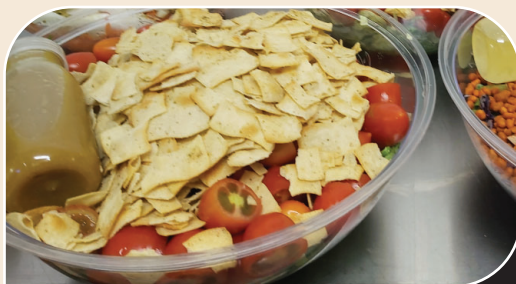
סלט חסה ושרי