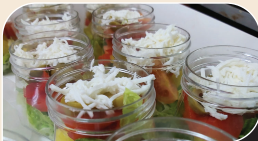
כוסיות סלט יוני