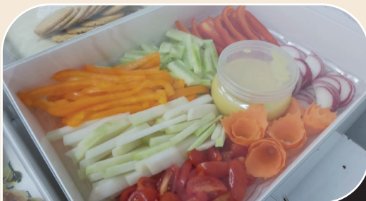
מגש ירקות חיים