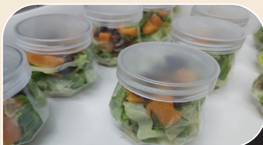
כוסות סלט חסה