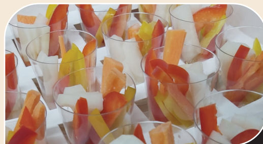
כוסיות מקלות ירקות