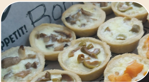
מגש מעורב קיש מלוח