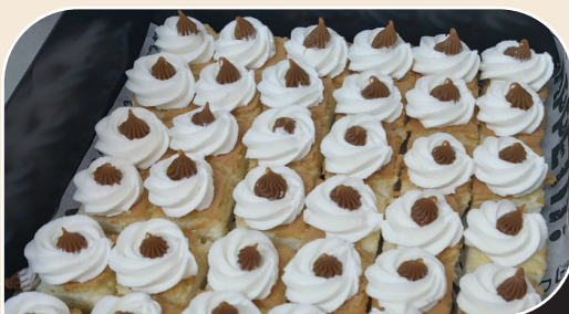
עוגת גבינה שמנת וריבת חלב