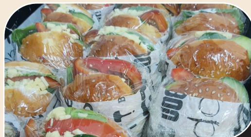
כריך אישי - גבינות וירקות