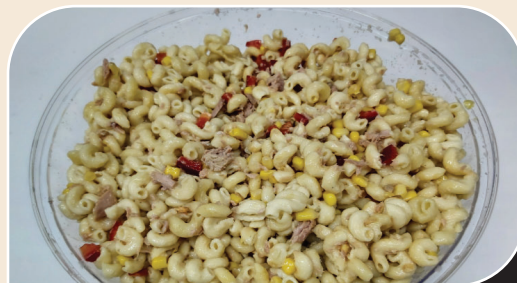
סלט פסטה קר