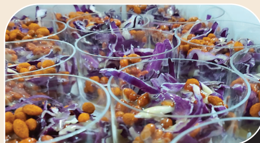
כוסיות סלט כרוב